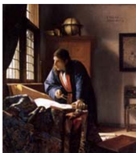
Vermeer, Il Geografo - 1668